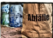
Titelbild: © Peter Kalterherberg

Kostenlos abzugebende, gut erhaltene Möbel können Sie auch unter der Rubrik „Möbelbörse“ im Stockacher Mitteilungsblatt zur Vermittlung anbieten. Wenden Sie sich bitte an das UMWELTZENTRUM STOCKACH.