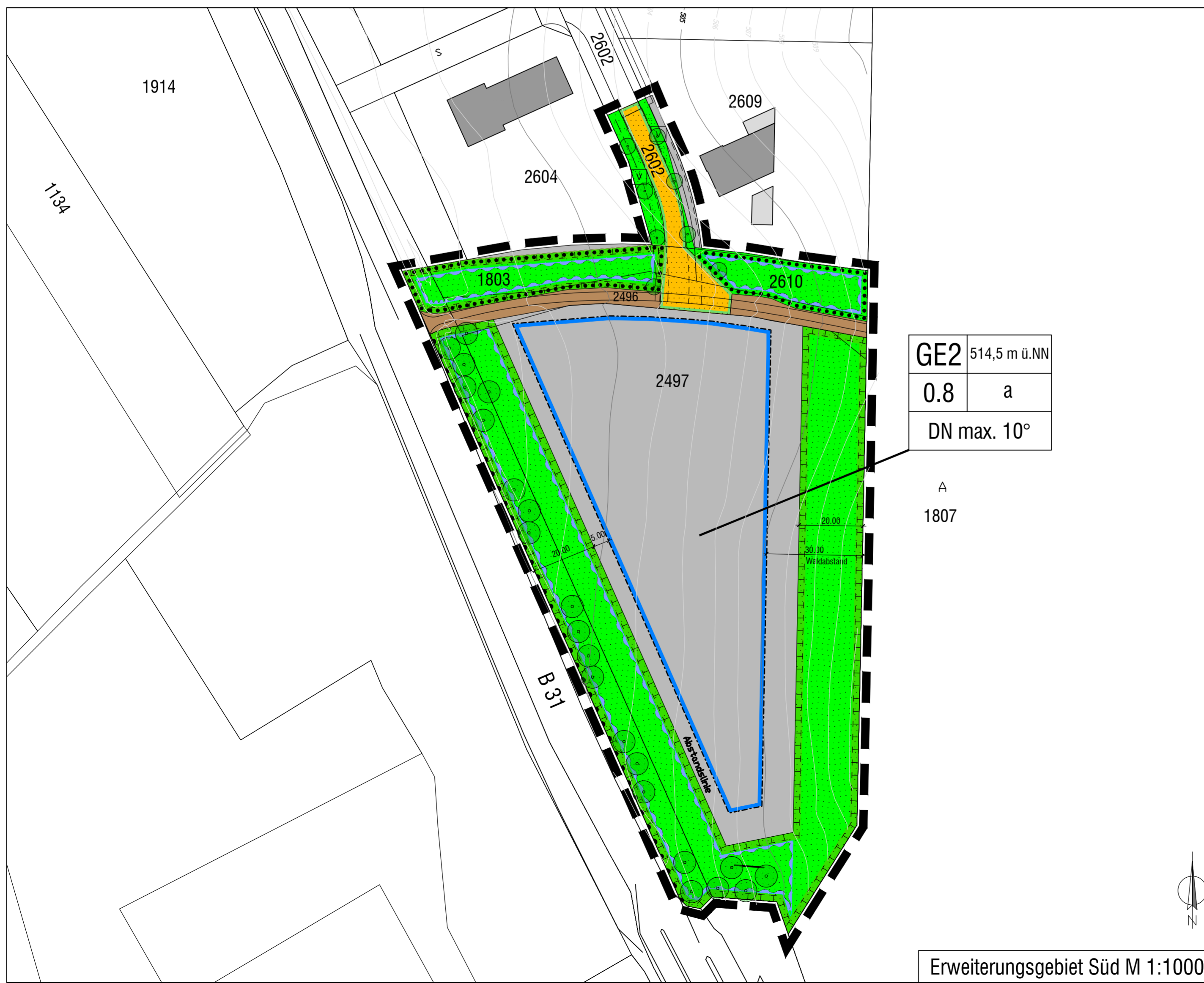
Erweiterungsgebiet Süd M 1:1000