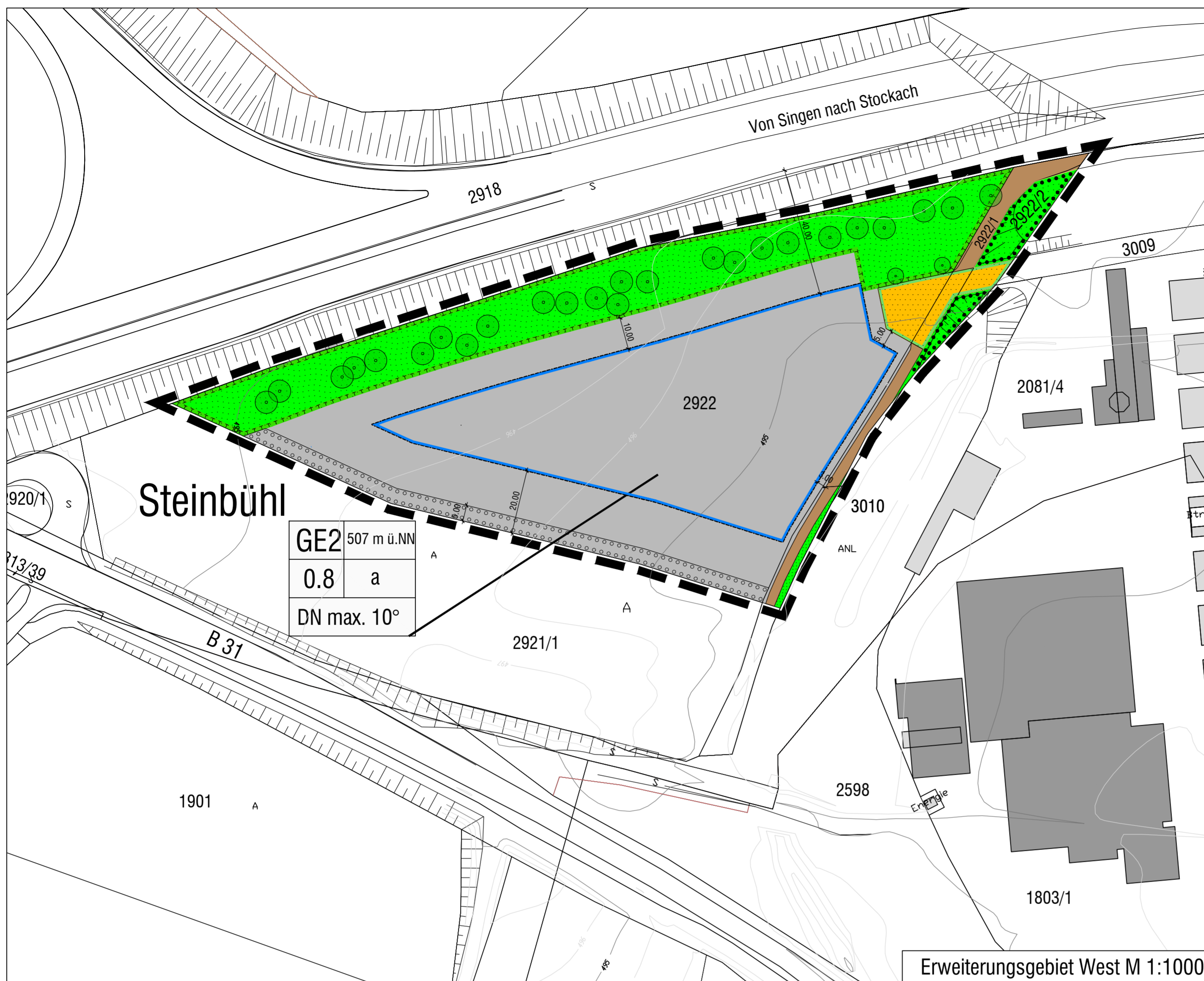
Erweiterungsgebiet West M 1:1000